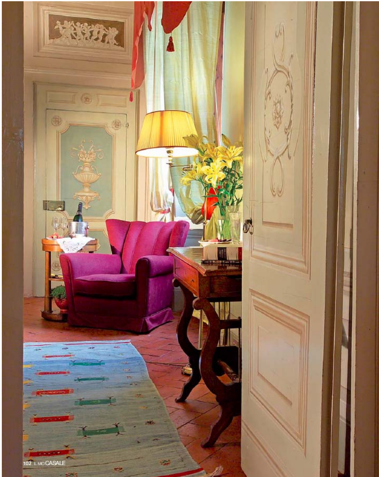
102 IL MIO CASALE